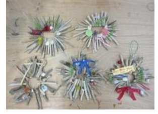
流木クリスマスリース