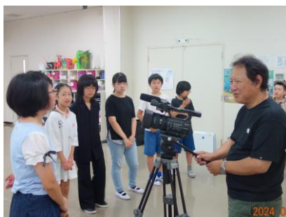
夏休みに映画撮影します