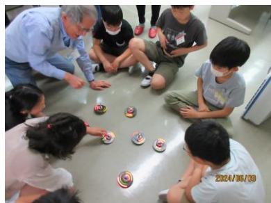
電子工作の例 「オルゴールごま」