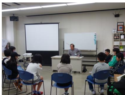
どんな映画にするか みんなでアイデアを出し合います