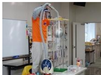
掃除機の力で、 重たいボーリングの球が 持ち上がりました。