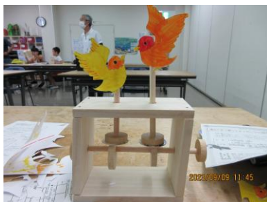
木工工作の例 「からくり箱」