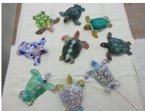
ペーパーマシェの亀

昨年度の活動内容は、 http://yume-mirai-english.sblo.jp/ にてご覧いただけます。