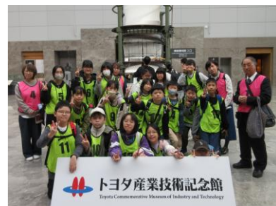
あいち少年少女創意くふう展 見学会