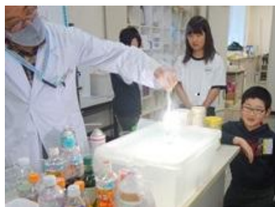
あっとビックリ！ ミニサイエンスショー

昨年度の活動は、 http://yume-mirai-science.sblo.jp/ にてご覧いただけます。