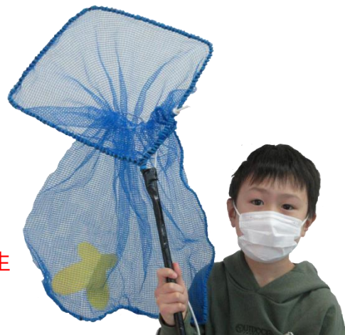
あいち少年少女創意くふう展2020 振興賞受賞作品 小鷹暖生くん(翼小4年生)作 「ただいま ほかく虫(ちゅう)」

昨年度の活動内容は、 http://yume-mirai-invention.sblo.jp/ にてご覧いただけます。