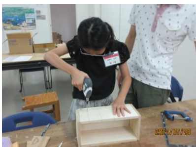
電動ドリルを使って組み立て