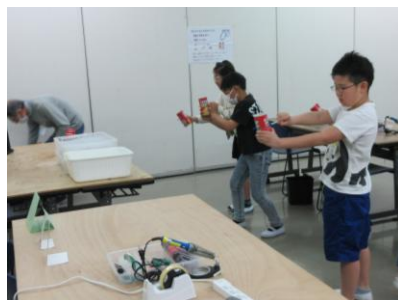
ストロー鉄砲を作った的当て遊び