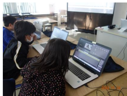
後半はおもしろ動画を 1人1作品制作します