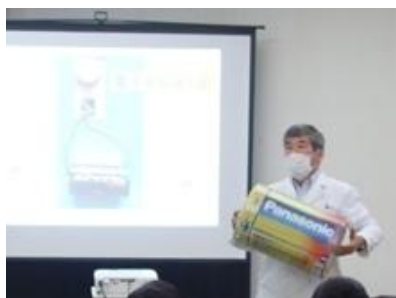
電池の仕組みを学んで、 10円玉と1円玉で電池を 作りました